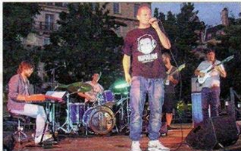
Place de l'hôtel de ville, 4DB et Kiddam se sont associés le temps d'une soirée.